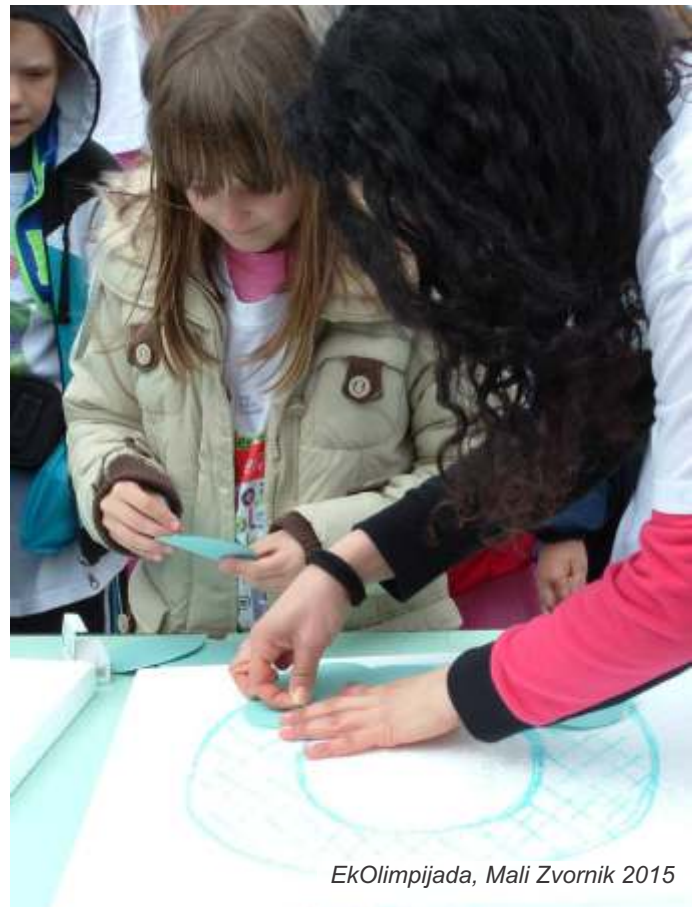
EkOlimpijada, Mali Zvornik 2015

EkOlimpijada je manifestacija koja traje već pet godina. Kako je predviđeno do kraja olimpijskog ciklusa u Riju 2016. godine, manifestacija će se održati u više gradova i opština širom Srbije.