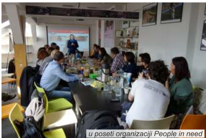
u poseti organizaciji People in need

Boravak u Češkoj za predstavnike konzorcijuma projekta „Dijalog za prevenciju prirodnog hazarda“ bio je prilika da saznaju više o upravljanju životnom sredinom u toj zemlji, načinu funkcionisanja i rada tamošnjih organizacija civilnog društva i fondovima koji podržavaju aktivnosti na zaštiti i očuvanju životne sredine. Petodnevno studijsko putovanje iskorišćeno je i za međusobno bolje upoznavanje i povezivanje organizacija civilnog društva iz Srbije, dobitnica SENSE grantova u drugom krugu, radi uspostavljanja kvalitetnije saradnje, povezivanja i umrežavanja.