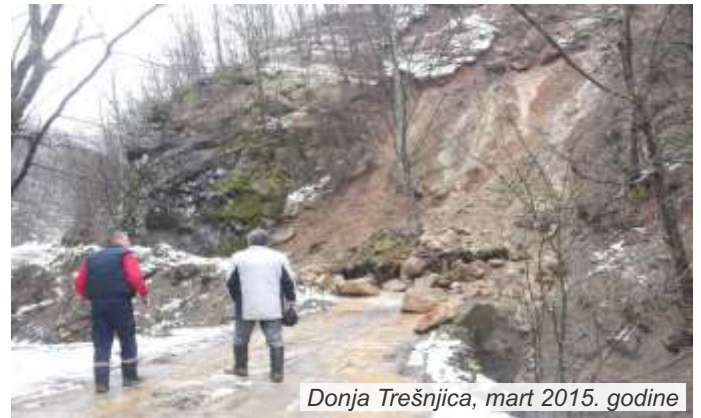
Donja Trešnjica, mart 2015. godine

Zbog ugroženosti stanovništva i materijalnih dobara u Ljuboviji je 07. marta proglašena vanredna situacija, dok je u Malom Zvorniku ona neprekidno na snazi već godinu dana, od maja prošle godine.