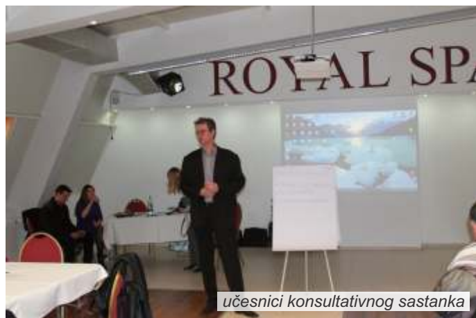
učesnici konsultativnog sastanka

Na sastanku su predstavljeni i rezultati dosadašnjeg procesa i metodološkog pristupa izradi Plana upravljanja rizikom od prirodnog hazarda u opštinama Mali Zvornik i Ljubovija, s ciljem upoznavanja svih zainteresovanih strana sa ovim procesom.