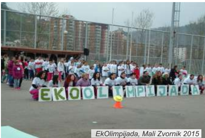
EkOlimpijada, Mali Zvornik 2015

Prva ovogodišnja „EkOlimpijada“ za učenike u organizaciji Olimpijskog komiteta Srbije i Fonda sporta i olimpizma održana je početkom aprila u Malom Zvorniku, pod sloganom „Moje školsko eko dvorište“. Na manifestaciji, čiji je cilj razvijanje sportskog duha kod osnovaca, učestvovalo je stotinak mališana, učenika pet osnovnih škola sa područja opštine Mali Zvornik.