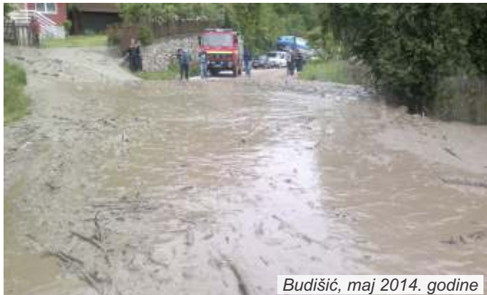
Budišić, maj 2014. godine

Zbog kvarova na dalekovodima, uzrokovanim nevremenom, prenos proizvedene električne energije preko dva od četiri dalekovoda 110kV u neposrednoj blizini HE „Zvornik“ u Malom Zvorniku neko vreme bio je onemogućen, zbog čega su bez struje bili i potrošači u