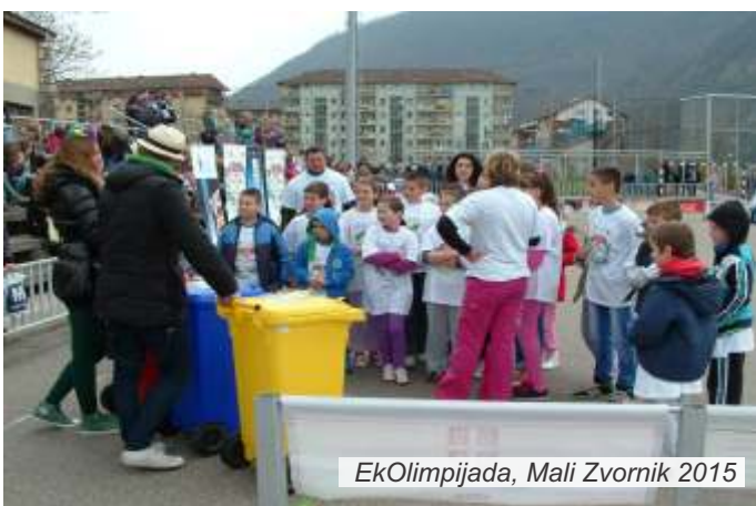
EkOlimpijada, Mali Zvornik 2015

Opština Mali Zvornik podržala je i pomogla realizaciju manifestacije.