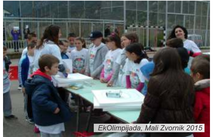
EkOlimpijada, Mali Zvornik 2015

U okviru manifestacije, malozvornički osnovci zasadili su pet stabala u školskom dvorištu OŠ „Stevan Filipović“ u Radalju. Pet stabala predstavlja pet olimpijskih vrednosti koje mladi treba da usvoje u svom svakodnevnom životu - radost igre,