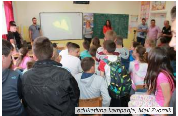
edukativna kampanja, Mali Zvornik

U drugom delu edukativne kampanje, tokom maja, slične radionice za osnovce biće održane u Krupnju i još jednoj osnovnoj školi u opštini Mali Zvornik.