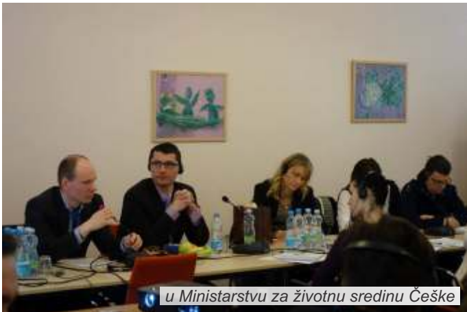
u Ministarstvu za životnu sredinu Češke

Članovi tima projekta „Dijalog za prevenciju prirodnog hazarda“ boravili su u Češkoj, na studijskom putovanju koje je za predstavnike organizacija civilnog društva u Srbiji (OCD), dobitnica SENSE grantova u drugom krugu, od 22. do 27. marta 2015. godine, organizovao Regionalni centar za životnu sredinu (REC), Kancelarija u Srbiji.