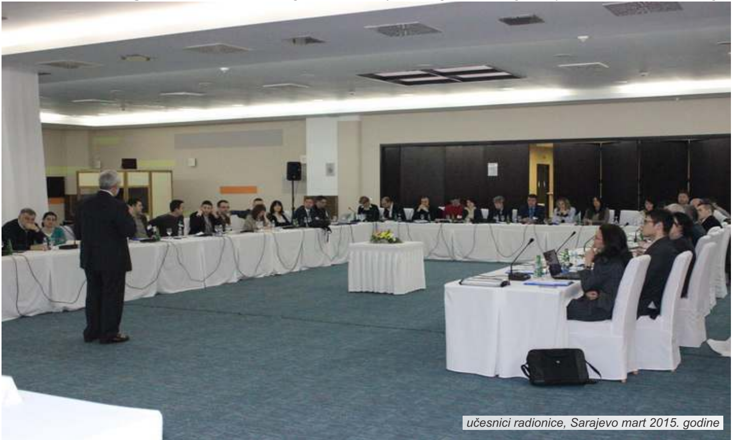
učesnici radionice, Sarajevo mart 2015. godine

Cilj ovog projekta je izgradnja kapaciteta lokalnih zajednica za održivi razvoj u BiH, Srbiji, Crnoj Gori, Albaniji, Makedoniji i Kosovu i pružanje podrške u kreiranju strateških dokumenata, te pružanje finansijske podrške za rešavanje