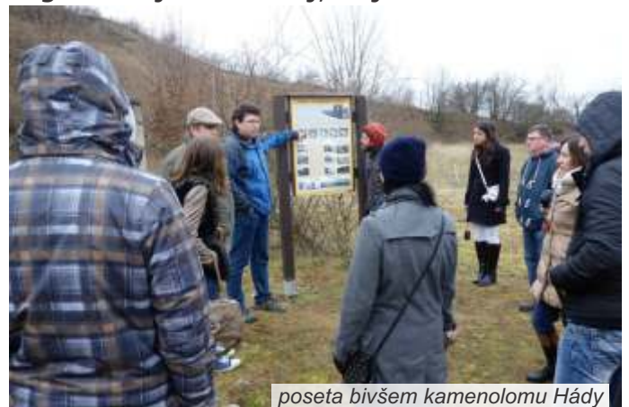
poseta bivšem kamenolomu Hádý

Tokom boravka u Češkoj učesnici studijskog putovanja sreli su se i razgovarali i sa predstavnicima organizacije GREEN CIRCLE krovne organizacije u Češkoj, koju čini mreža od