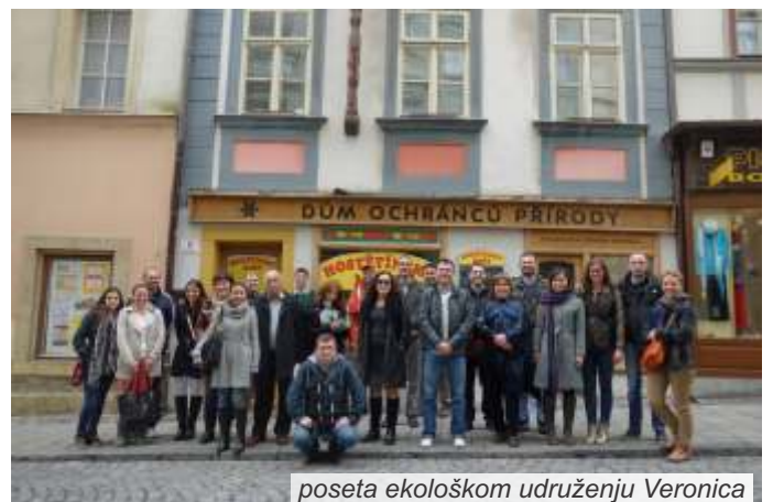
poseta ekološkom udruženju Veronica