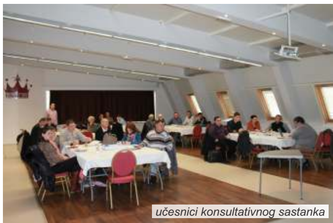
učesnici konsultativnog sastanka

Učesnici su u zajedničkom dijalogu razmatrali kadrovske i materijalne kapacitete na lokalnu i definisali probleme i nedostatke. Predlozi i zaključci utvrđeni na ovom skupu predstavljaju inpute za organizovanje konsultativnog sastanka u maju sa donosiocima odluka na nacionalnom nivou.