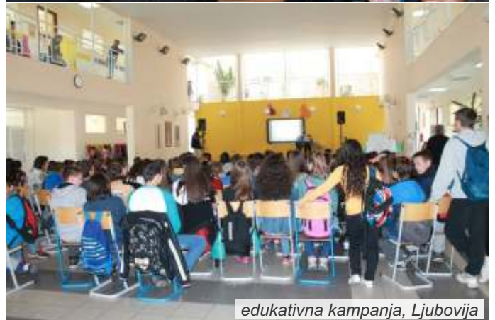
edukativna kampanja, Ljubovija