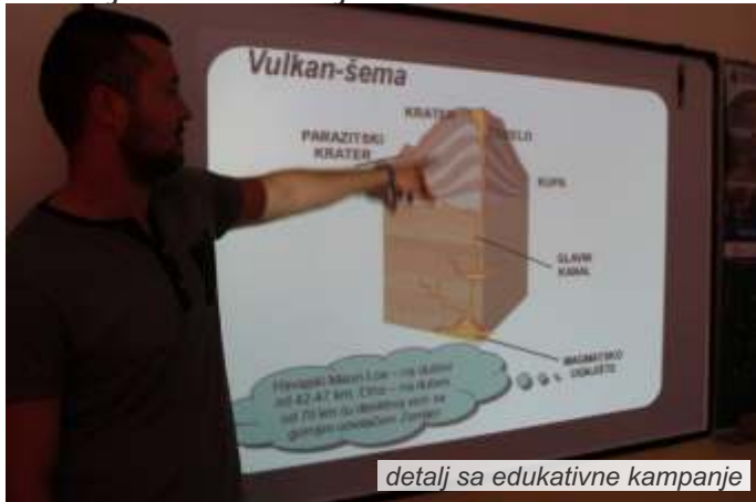
detalj sa edukativne kampanje

E dukativne radionice za osnovce posvećene klimatskim promenama i prirodnom hazardu održane su krajem aprila u školama u Malom Zvorniku i Ljuboviji, u okviru edukativne kampanje projekta „Dijalog za prevenciju prirodnog hazarda“. Radionice su održane u osnovnim školama „Stevan Filipović“ u Radalju i „Petar Vragolić“ u Ljuboviji. U edukaciji je učestvovalo oko 170 učenika, uzrasta od petog do osmog razreda, koji su bili u prilici da, u okviru dva školska časa, putem zanimljivih prezentacija, saznaju više o ovoj temi.